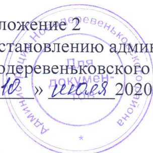
График проверки готовности организаций, осуществляющих образовательную деятельность, к новому 2020 – 2021 учебному году.

Приложение 2 к постановлению администрации Новодеревеньковского района от « 10 » августа 2020 г. № 141